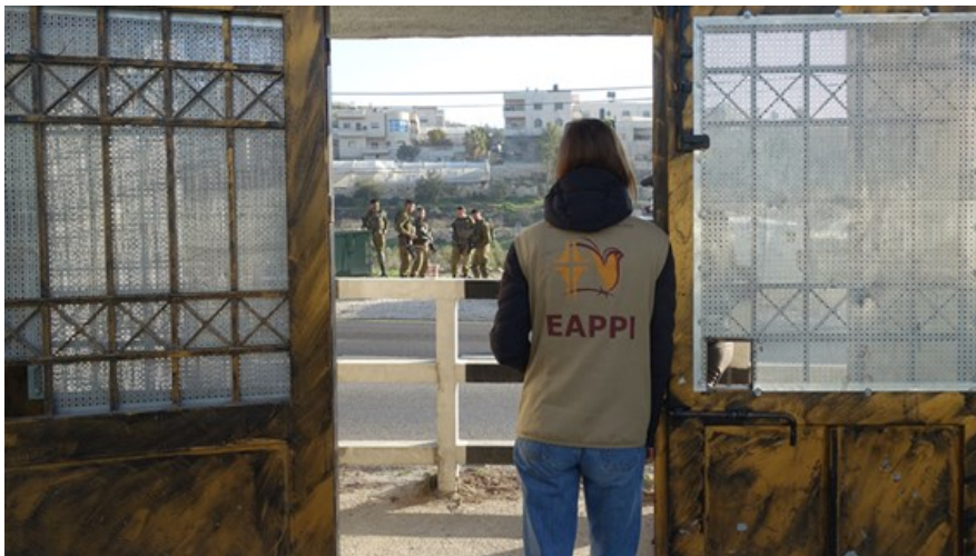
Följeslagare på plats vid porten till en skola där elever dagligen möter israeliska soldater och bosättare.