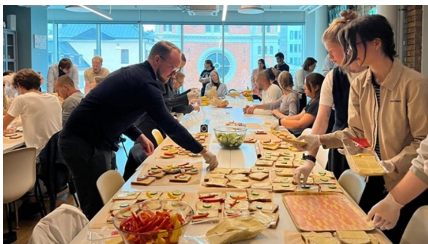
Macktillverkning i Caritas ungdoms regi. Caritas är katolska kyrkans biståndsorganisation.