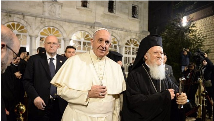
Påven Franciskus och patriark Barholomaiois.