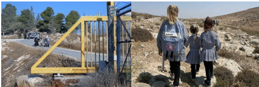
Den 2 km långa vägen till skolan vandrar barnen delvis eskorterade av följeslagare, delvis av israeliska soldater. (Sep 2023)