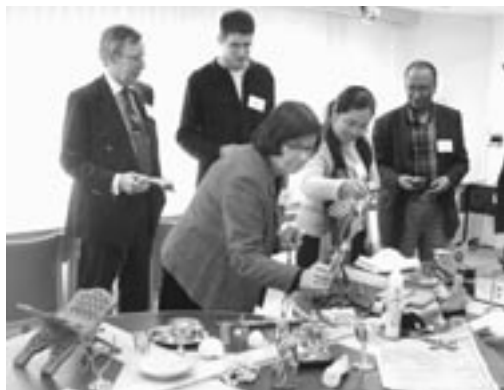
Deltagarna undersöker varandras religiösa ting och symboler.