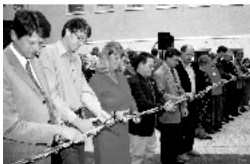
Representanter för de olika organisationerna i Ekumeniska centret vid invigningen i augusti.

Ett viktigt nytt steg för svensk ekumenik togs 2001 då Ekumeniska centret flyttade till nya lokaler i Sundbyberg. Flytten var föranledd av ekonomisk nödvändighet men detta tvång öppnade för en kreativ process, där till slut praktiskt taget samtliga organisationer som levde tillsammans i det gamla Ekumeniska centret flyttade med till Sundbyberg. Dessutom anslöt sig Svenska Baptistsamfundet och