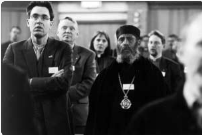
Årsmötets öppningsgudstjänst hölls i Pingstkyrkan i Jönköping. På bilden har rådsförsamlingen stämt upp i en inledande psalm.